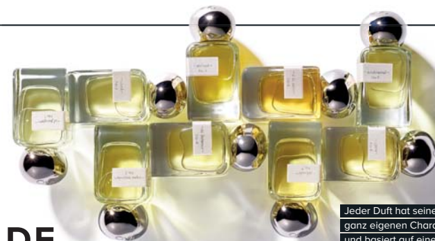
Jeder Duft hat seinen ganz eigenen Charakter und basiert auf einer sehr persönlichen Geschichte