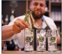
Ein Klassiker: Gin Tonic

Exklusiv für BZ-Card-Inhaber verlosen wir 5 x 2 Premium-Tickets für die Gin A' Fair. Neben dem Eintritt zum Festival beinhaltet der Gewinn je ein Gin Tonic nach Wahl und eine Einladung zur Aftershow-Party. Zudem neh-